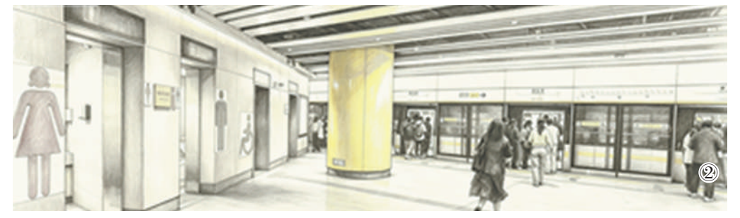
AI修饰生成素描画 图②:深圳地铁黄木岗综合交通枢纽二层公共厕所。AI修饰生成素描画

洁员常态化值守,每个公厕均设置专岗保洁员,在开站期间执行小时制清洁消杀工作,关站期间进行深度清洁消杀,同时执行“定时清洁+不定时巡检”的保洁流程,实现“一客一洁”。目前,深圳地铁已投入全自动洗地机、高压清洗机