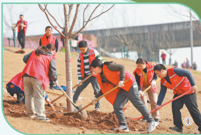
图1: 园林志愿者在湖北宜昌市伍家岗区柏临河畔栽种樱花树苗。