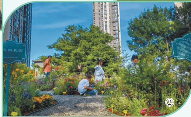
图2: 北京市通州区紫荆雅苑社区微花园一景。