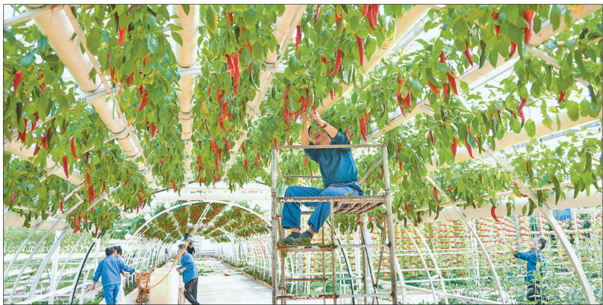
近日，第二十七届中国（寿光）国际蔬菜科技博览会进入布展收尾阶段，用于布展的温室大棚各项设施调试完毕。

香港特区政府行政长官李家超，中央和国家机关有关部门负责人，香港各界人士、妇女组织代表，有关国际组织代表，大湾区及内地妇联组织代表一千多人参加活动。