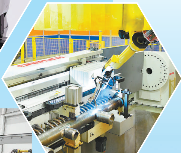
▲浙江嘉兴经开区城南街道一家企业,机器人正在焊接马鞍形钢管构件。机器人的使用提升了生产效率,降低了人工焊接风险。