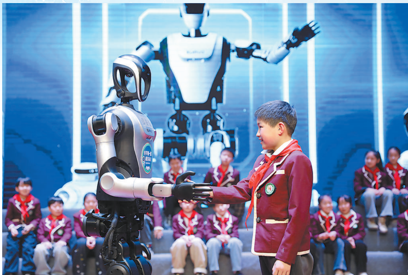
▲江苏海安城市城南实验小学,学生与人形机器人互动。