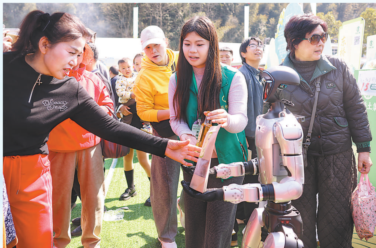
▼在江西萍乡市湘东区东桥镇集市上,人形机器人化身导购,推销乡村土特产。