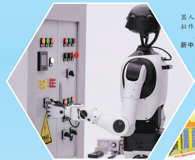
▲具身天工3.0机器人进行电控柜操作模拟作业。