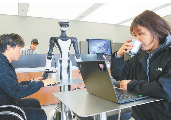
▲在浙江湖州市吴兴区机器人主题咖啡店,机器人在送咖啡。