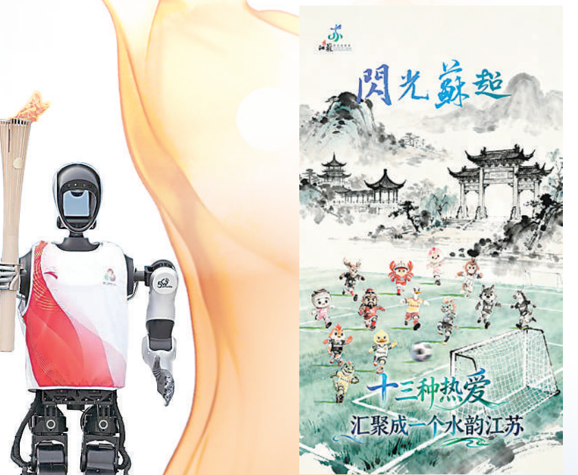
▲“闪光苏超”海报。