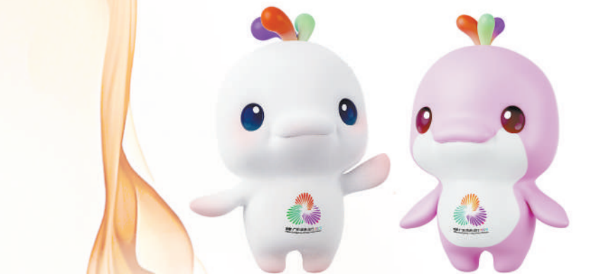
▲十五运会吉祥物“喜洋洋”“乐融融”。