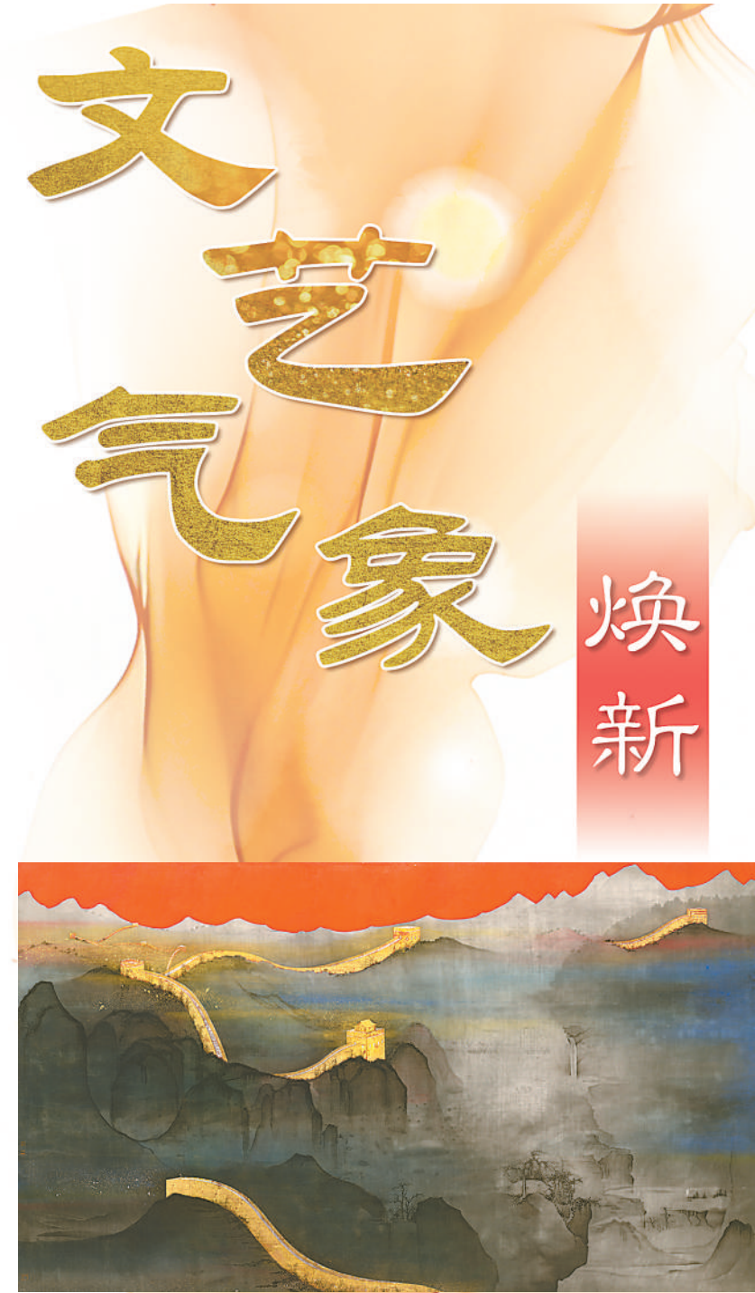
▲中国画《光芒万丈》，作者籍洪达。