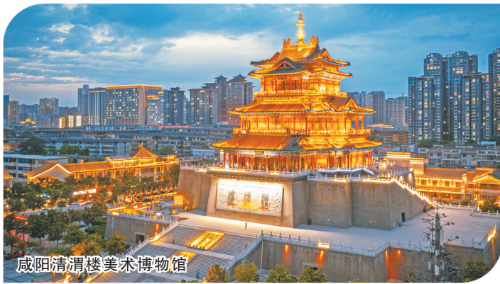
咸阳渭渭楼美术博物馆