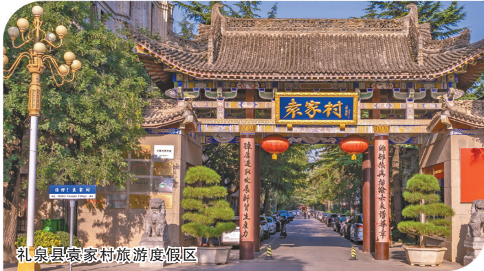
礼泉县袁家村旅游度假区