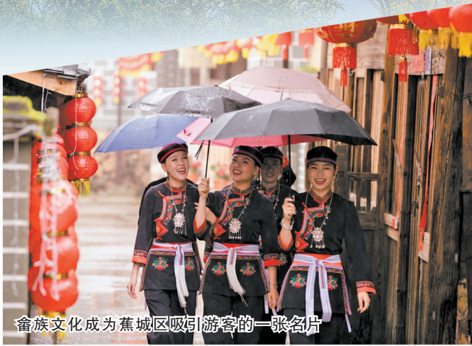
畲族文化成为蕉城区吸引游客的一张名片

山海宁德持续出圈。百个金牌旅游村覆盖全城，千余个文旅项目落地生根，霞浦县东壁村“摄影+民宿”、福安市坦洋村“非遗+旅游”、柘荣县洪坑村“研学+旅游”、福鼎市嵛山岛“海上草原+度假”等备受游客青睐，“东海1号”风景观光道等线路常年跻身抖音、携程等平台的推荐榜单。