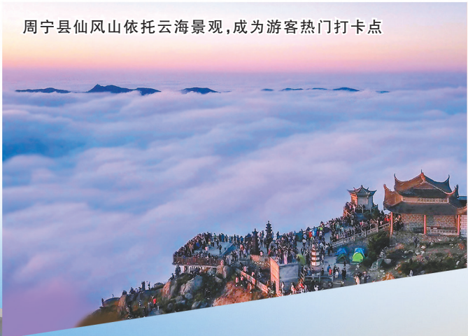
周宁县仙风山依托云海景观，成为游客热门打卡点

乐业；寿宁县下乡干部群众以弱鸟先飞的追赶、滴水穿石的坚韧，奋力摆脱贫困，走向乡村全面振兴，实现华丽蜕变；锂电新能源、新能源汽车、不锈钢新材料和铜材料四大主导产业敢于创新、攻坚克难，撑起宁德高质量发展的“四梁八柱”，向“新”向“绿”节生长。