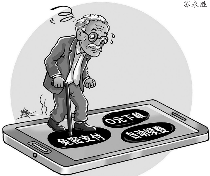
↑ 误入迷魂阵 戴继斌