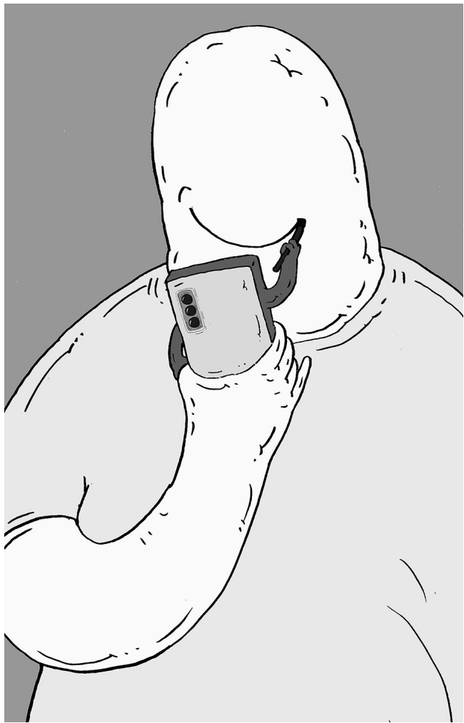
↑ 我很想快乐 苏永胜