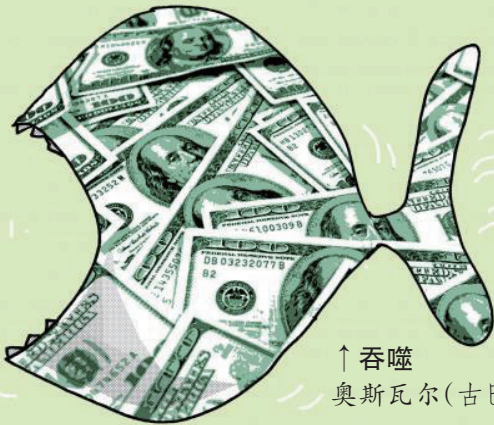
↑ 吞噬 奥斯瓦尔(古巴)