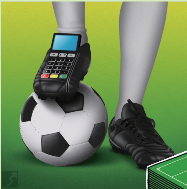
↑ 待价而沽 萨曼·托拉比(伊朗)