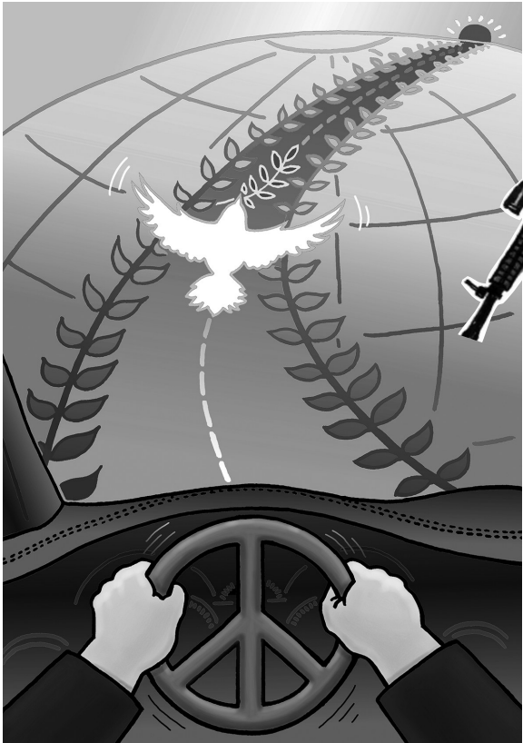
↑ 和平之旅 王 真