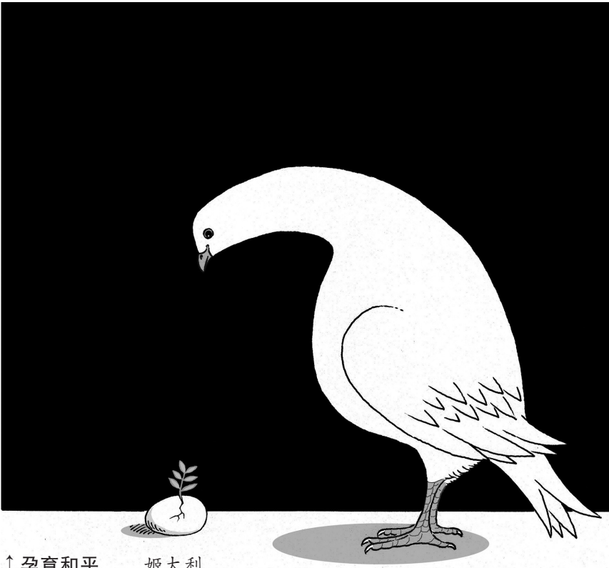
↑ 孕育和平 姬大利