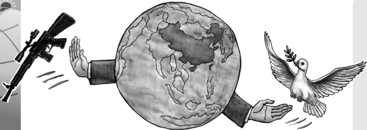
↑ 取与舍 姚永健