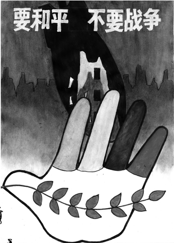
↑ 要和平 不要战争 巫德华