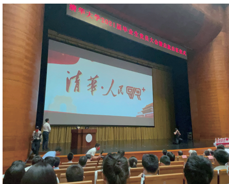
“清华·人民VR+”发布现场

本报讯（记者岳秋童）6月21日，清华大学2021届毕业生党员大会暨启航出征仪式在新清华学堂举行。清华大学与人民日报漫画增刊开展战略合作推出的“清华·人民VR+”也在大会上亮相，助力党史学习教育，赋能智慧科技云党建。