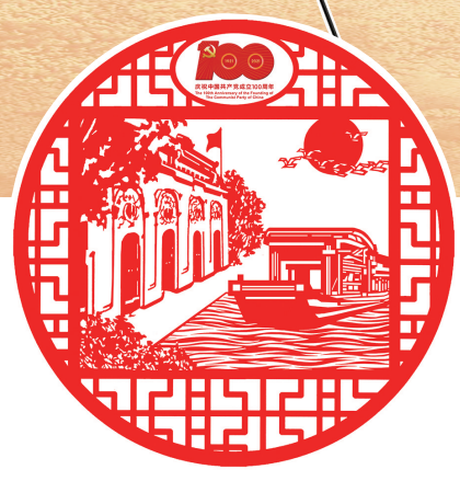
一大会议址与红船启航