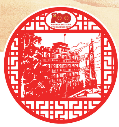
八一南昌起义纪念馆