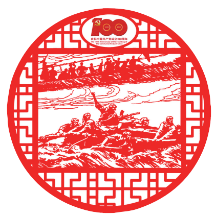
强渡大渡河与飞夺泸定桥