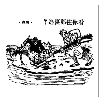
图一 看你往哪里逃?