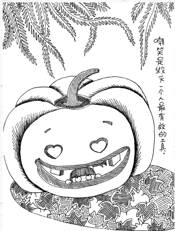
嘲笑是毁灭一个人最有利的工具。