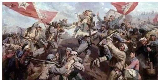
图一 三大主力会师

授)注:图一作者蔡亮、张自巖,创作于1977年,中国人民革命军事博物馆藏。图二作者黄镇,选自《长征画集》第57页。