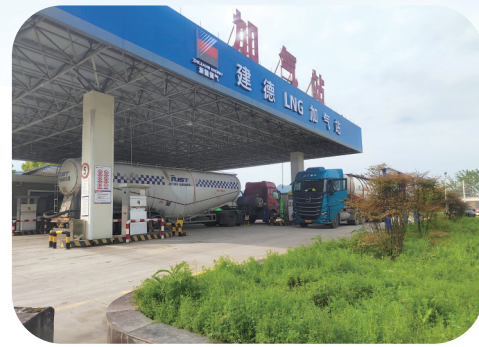
▲ 建德公司 LNG 加气站成功试运营。