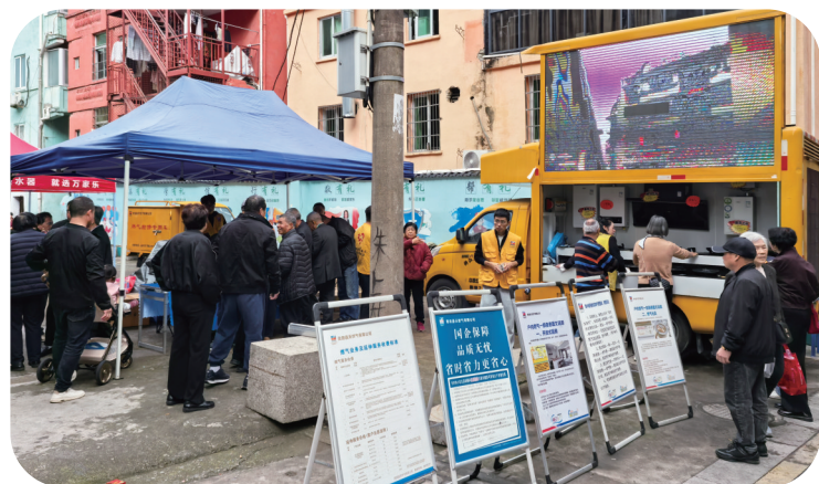
▲ 花园降小区“瓶改管”通气现场便民服务。

从管道中流淌的清洁能源，到灶台上跳动的温暖火苗，浙能燃气守护的不仅是清洁能源，更是民生温度。每一次服务的升级，都是为了回应群众对美好生活的向往。立足新起点，展望“十五五”，浙能燃气将继续深耕城燃沃土，探索多元业态，用实际行动诠释“为民初心”，让每一份信任温暖如初。