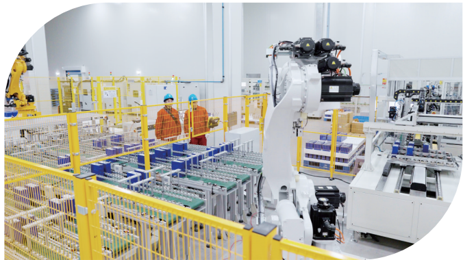
图为国网遂昌县供电公司员工到宇恒电池股份有限公司开展用电检查，指导企业优化用电方案，降本增效。