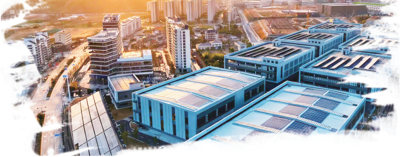
图为遂昌县云峰工业园区屋顶光伏在晨光照射下熠熠生辉。

余杭盛兴电商、云计算、人工智能产业集群。当很多县域还在追求“不停电”时，余杭已经把未来科技城的供电可靠率提升