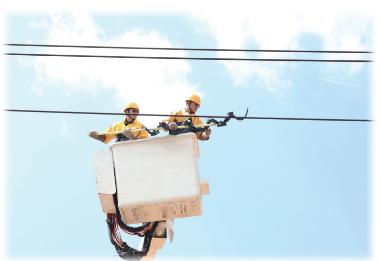
图为工作人员利用蛇形机器人开展线路巡检工作。