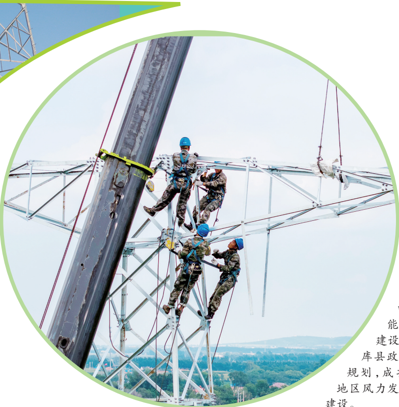
沈阳供电公司将新能源消纳电网建设项目纳入法库县政府地区发展规划,成功实施法库地区风力发电送出工程建设。