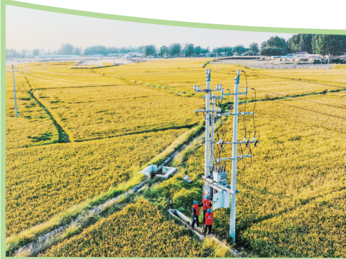
▼ 锦州供电公司员工在黑山县现代农业服务有限公司了解客户用电需求。