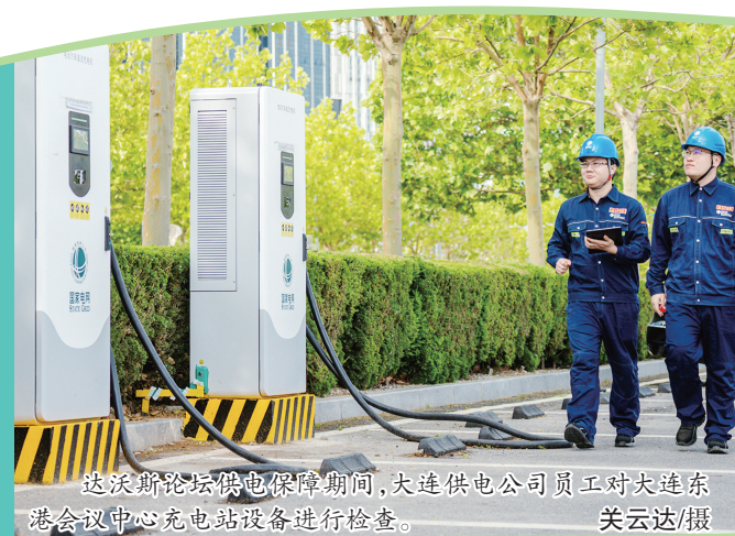
达沃斯论坛供电保障期间,大连供电公司员工对大连东港会议中心充电站设备进行检查。