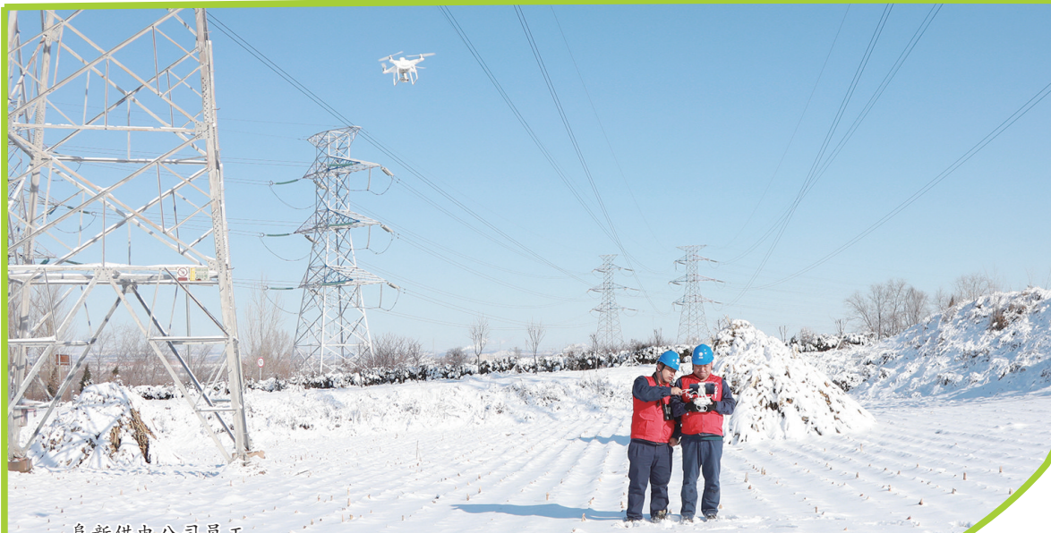
阜新供电公司员工对220千伏阜宁二线开展特巡,查看线路覆冰情况,全力确保电网安全稳定运行。