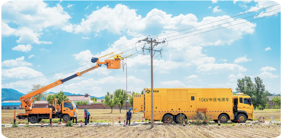
鞍山供电公司在鞍山市大孤山镇开展10千伏伏和宫线大孤山分A、B、C相带电拆除旁路电缆作业。

沈阳市领导及市建设局23次召开沈阳市电力调度会议,协调解决各类问题62项,确保电网建设项目有序推进。沈阳供电公司政企高效协作,全面取消二环以内