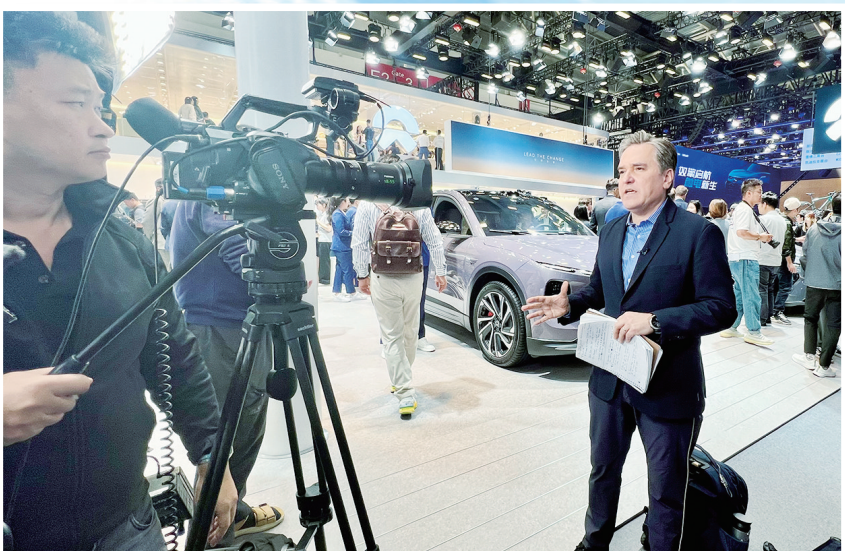
一位美国记者在蔚来汽车展台前作视频连线。