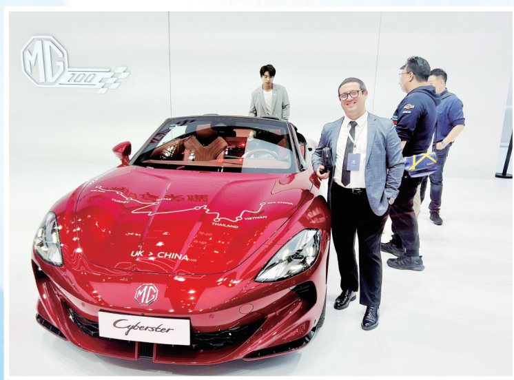
一位外国友人在名爵汽车前留影。