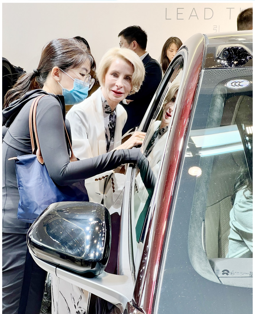
一位外国友人边与助手交流,边仔细观看展车。