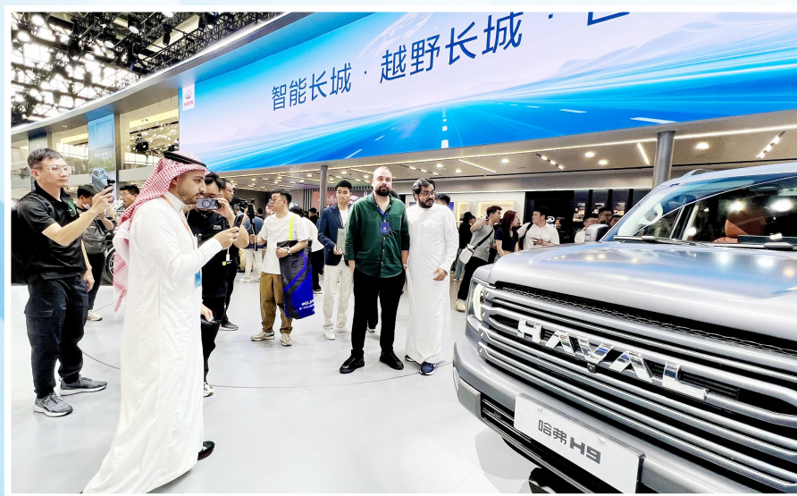
几位来自中东的媒体人观看长城汽车。