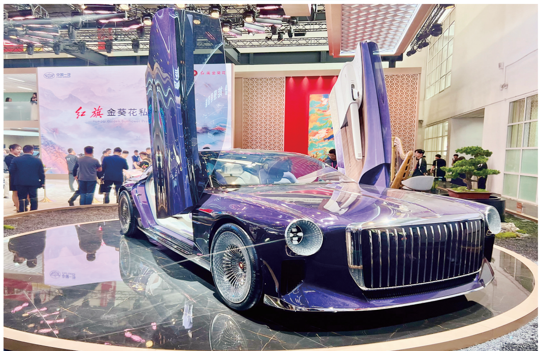
红旗展台上展出的L-Concept概念车。