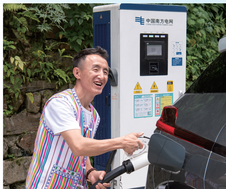
南方电网公司完成南方区域充电桩乡镇全覆盖。图为独龙江乡群众在用充电桩为新能源汽车充电。

服务乡村振兴。 2022年度投入315亿元开展农网建设改造，独龙江乡35千伏联网工程建成投运。截至目前，建成“南网知行书屋”360间，直接惠及乡村儿童约36万名。