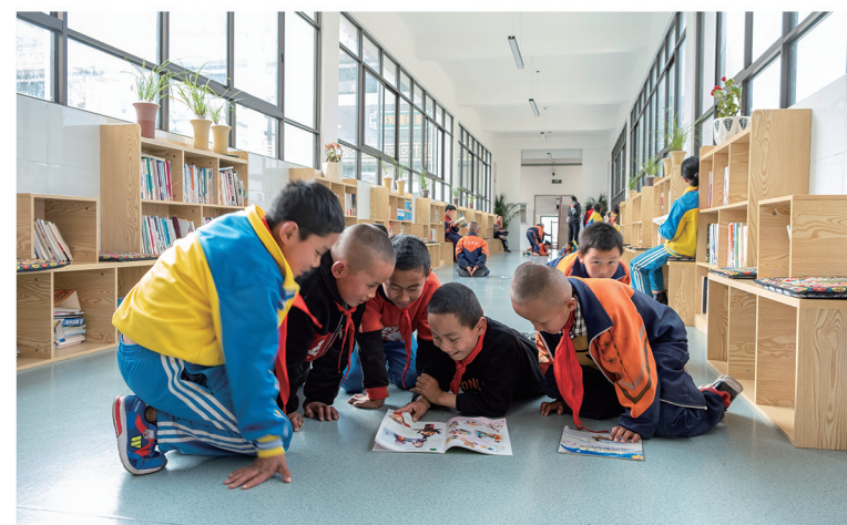
南方电网公司在广大乡村累计建设“南网知行书屋”360间，为孩子们提供探索世界的“钥匙”。图为孩子们在“南网知行书屋”阅读书籍。

共建绿色低碳社会。 全面构建充换电服务生态，累计建成充电桩近10万支，并于今年9月底实现经营区域内所有乡镇全覆盖。积极推广港口岸电、空港陆电、油机改电等电能替代技术。上线“低碳生活”“绿电历”“低碳用电账单”“碳普惠”等服务，助力居民用户绿色低碳生活。