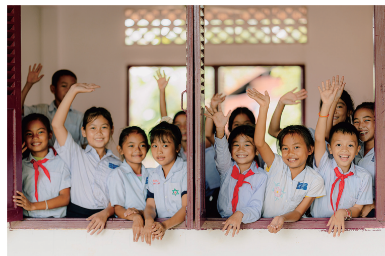
南方电网公司在老挝开展“希望之光”公益行活动，改善当地学校教学条件。图为西维莱小学的师生们，南方电网公司为该学校置换了桌椅、修缮了屋顶。

以治理现代夯实一流。 编制并推广应用《不同治理结构公司治理范本》。在国企改革三年行动2022年度考核中排名央企第一，“双百”“科改”专项考核获“9个标杆、1个优秀”，位居央企第一。