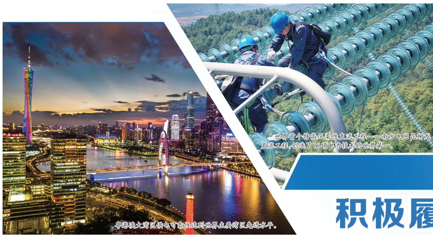
世界首个特高压柔性直流工程——南方电网昆柳龙直流工程，创造了19项电力技术的世界第一。