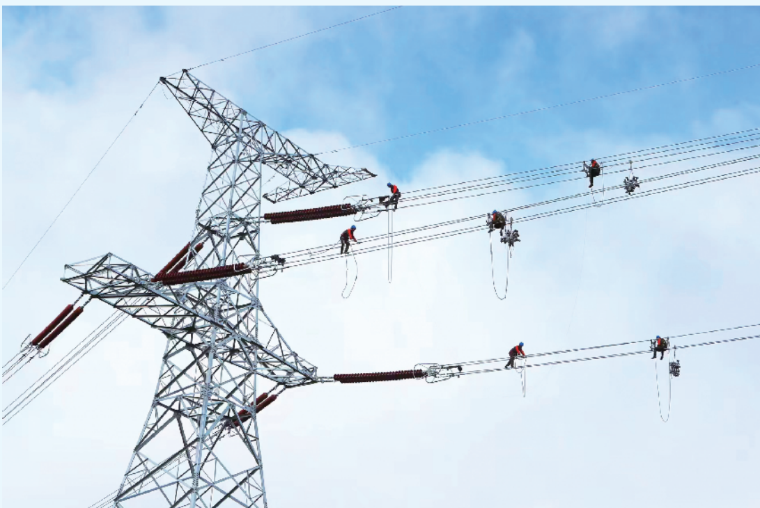
在凌绥高速 500 千伏燕利线施工现场,国网辽宁省朝阳供电公司工人正在组塔架线施工。