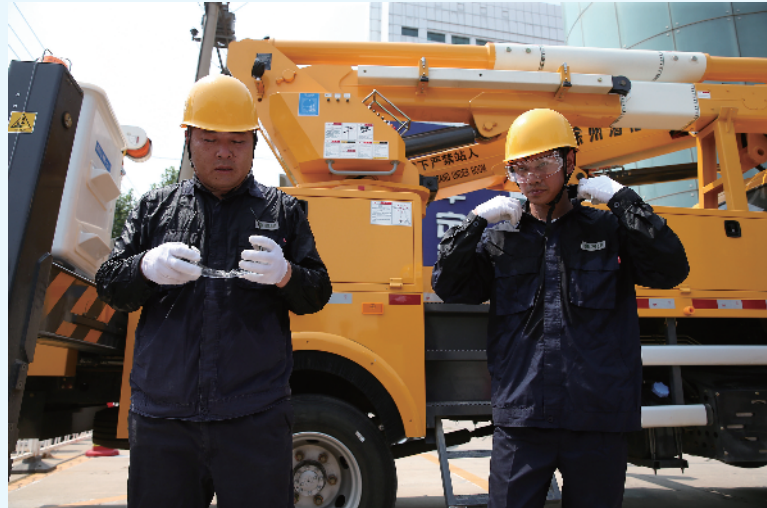
完成带电作业的国网石家庄供电公司工作人员,汗水已浸透衣服。