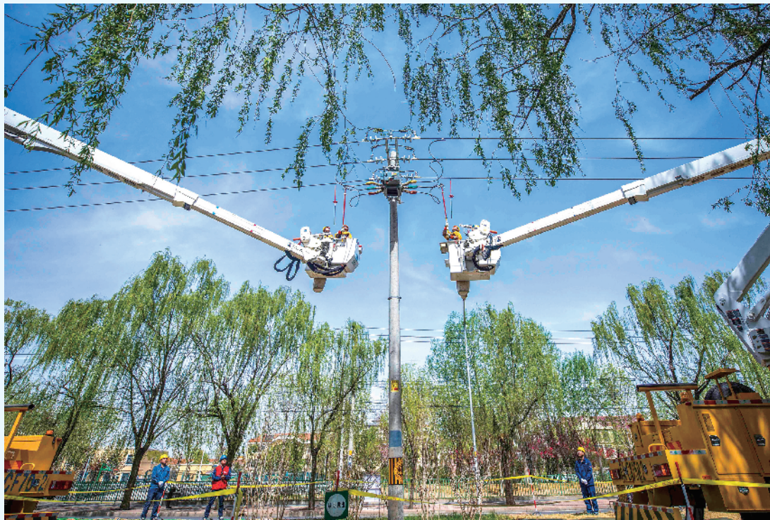
近日,国网北京电力带电作业人员在海淀区西北旺永丰地区进行配电网带电综合检修。