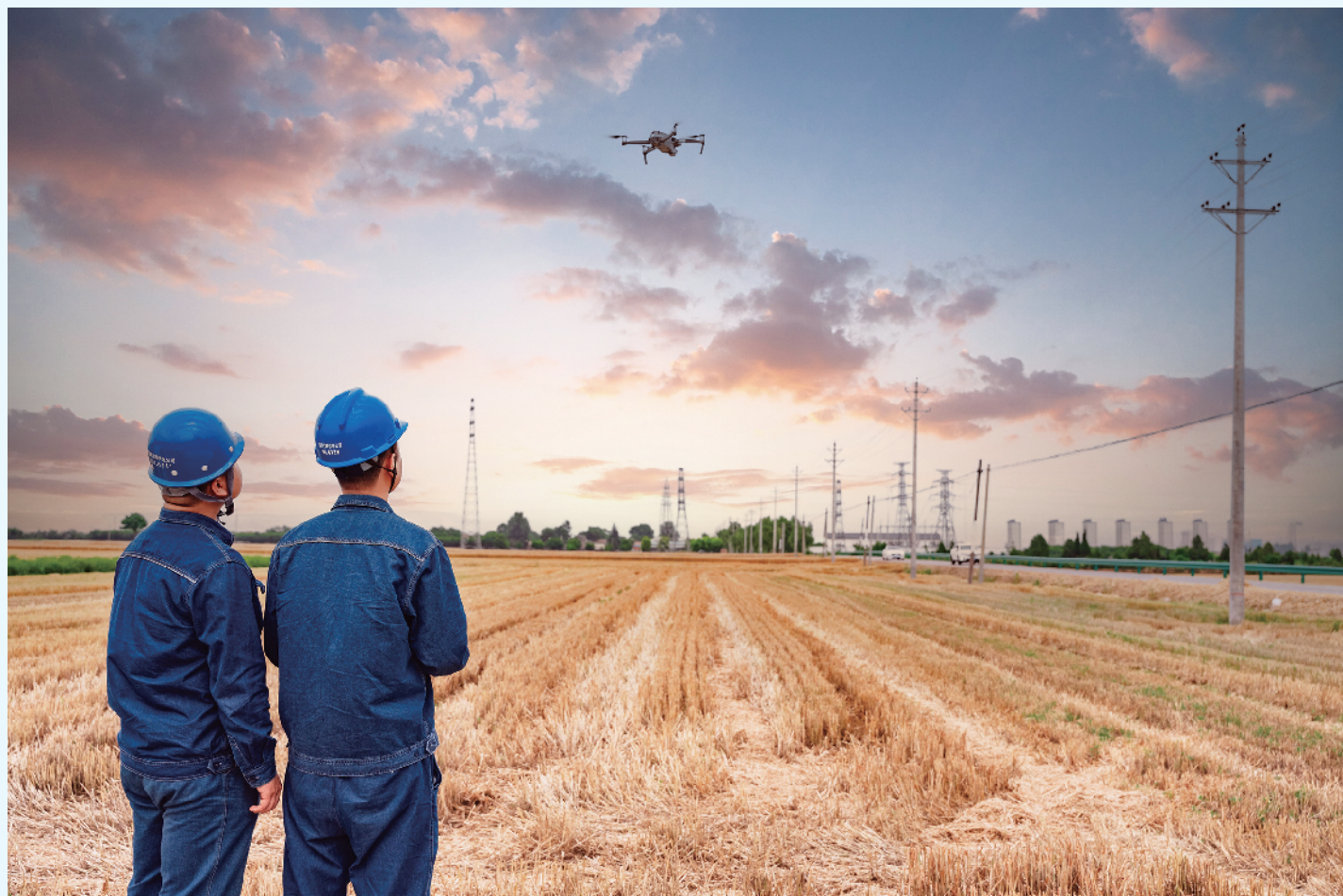
国网宝鸡供电公司员工利用无人机开展配网线路巡检。