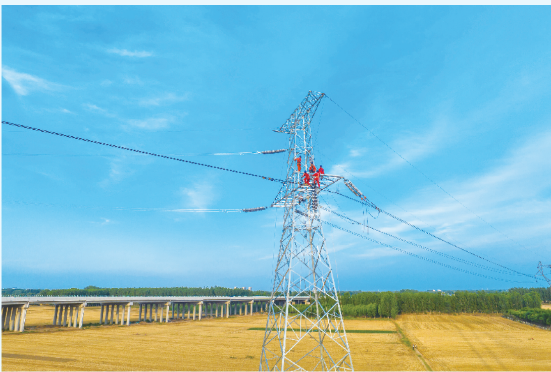
国网聊城供电公司工作人员冒着高温完成济郑高铁聊城西牵引站 220 千伏线路工程跨越京九铁路段架线施工任务。