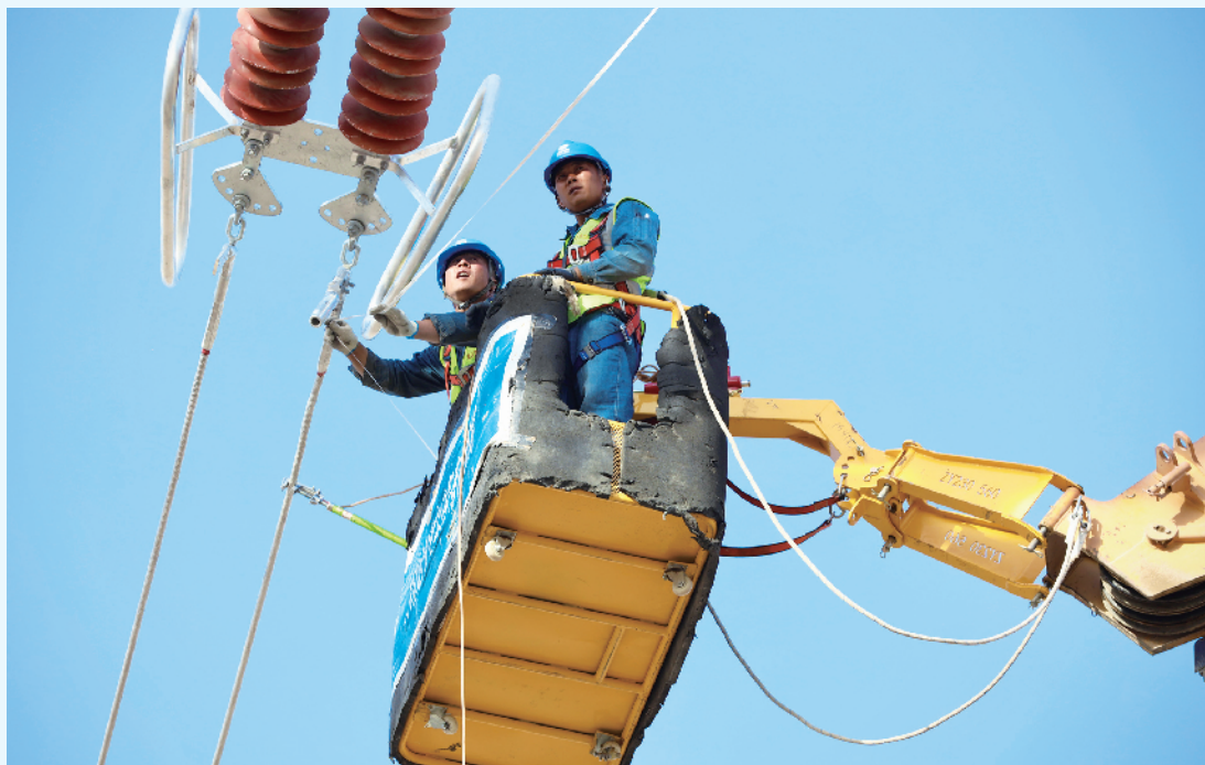
国网甘肃省电力公司超高压公司员工在 750 千伏河西变电站 330 千伏母线上开展停电检修。