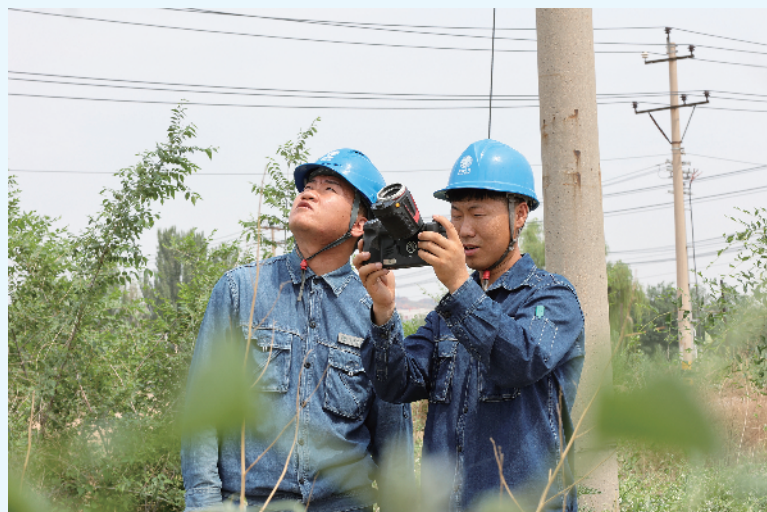
7月20日,国网赤峰供电公司红山供电服务中心员工开展线路特巡。