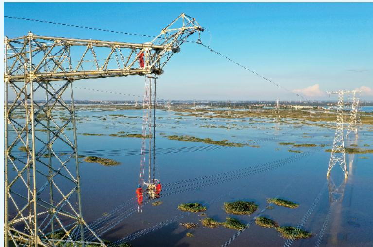
国网江西省送变电工程公司工人近日在武南线特高压铁塔上作业。