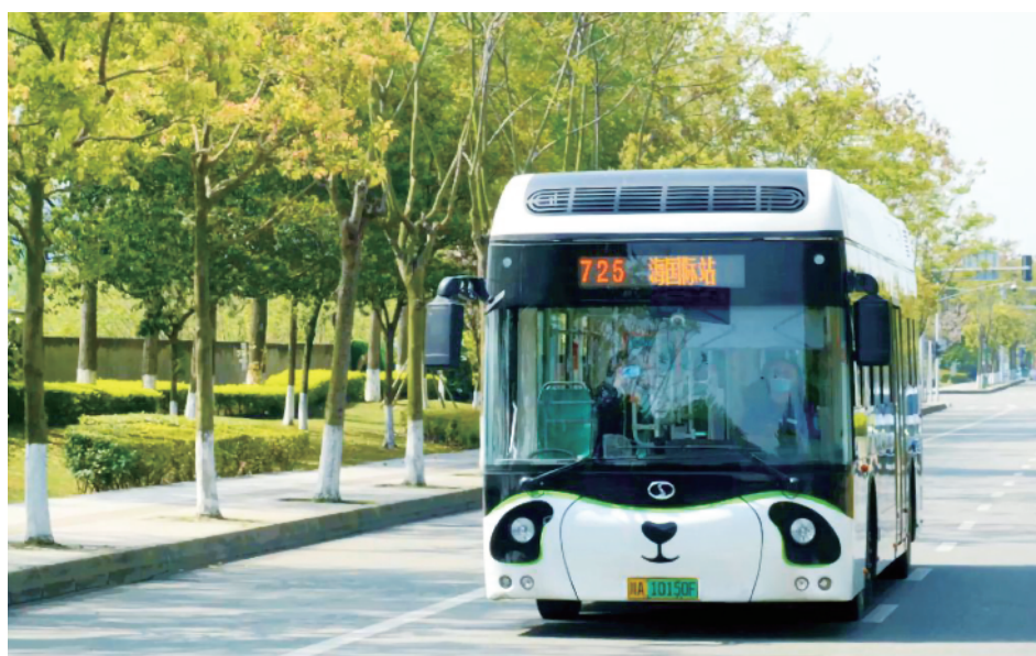
图为投入大运会服务的氢燃料电池大巴。刘敏雷 摄影报道

本报讯 7月28日,第31届世界大学生夏季运动会(以下简称“成都大运会”)开幕式在四川省成都市举行。大运会坚持绿色低碳办赛,氢燃料电池汽车成为承担大运会交通服务保障的主要力量,受到各界的广泛关注。