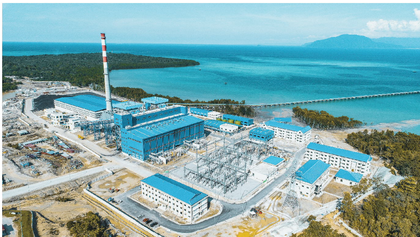
图为印尼大唐金光肯达里发电公司。