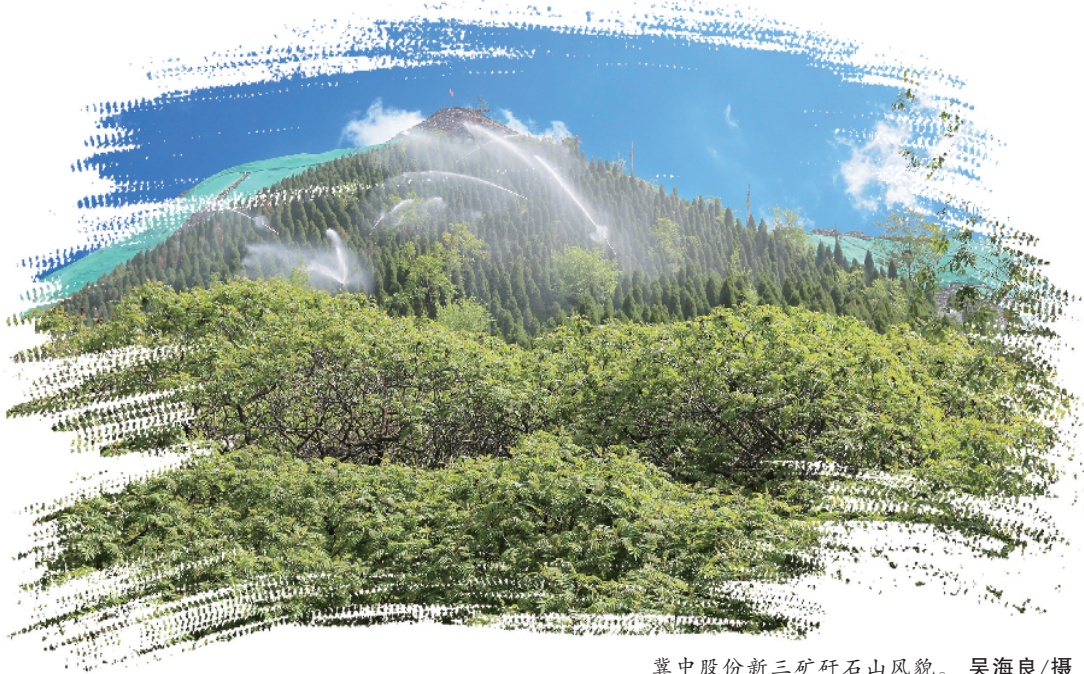
冀中股份新三矿矸石山风貌。