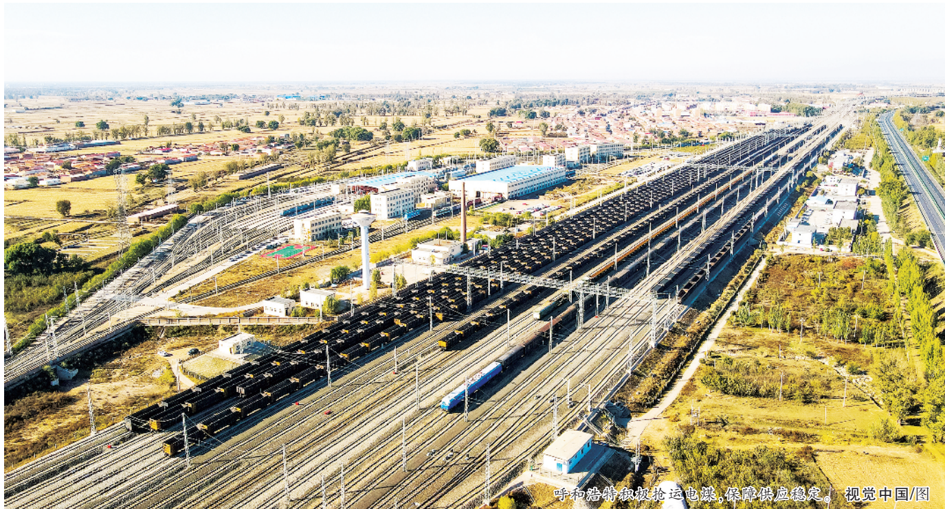
呼和浩特银板抢运电煤,保障供应稳定。

从企业角度,此模式对进一步节约企业经营成本,充分盘活碳排放权交易市场,疏通碳价与电价的传导渠道具有重要意义。(史轶夫)