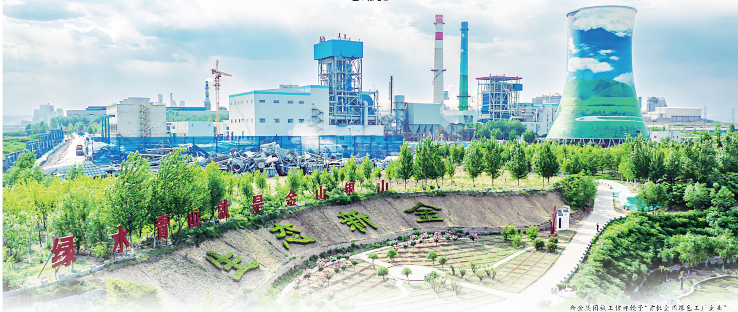
新金集团被工信部授予“首批全国绿色工厂企业”

河北新金钢铁有限公司(以下简称“新金集团”)始建于 1993 年,是冀南地区民营企业中第一家从烧结、炼铁、炼钢、热轧、冷轧、镀锌、彩涂到剪切配送,实现全流程自产自营的家电材料生产企业。公司主要产品有酸洗板、冷轧板、有花镀锌板、家电镀锌板、家电印花覆膜板等,产品主要供应海尔、美的、海信、澳柯玛、三星等十几家国内外知名品牌。