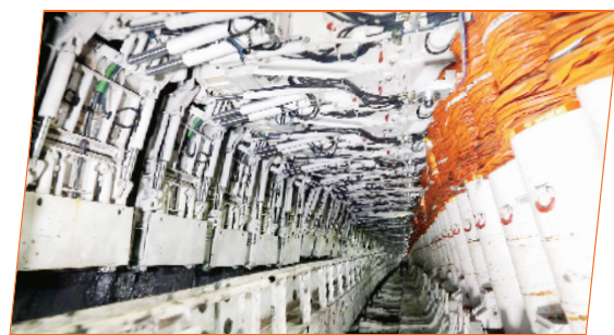
智能化综采工作面