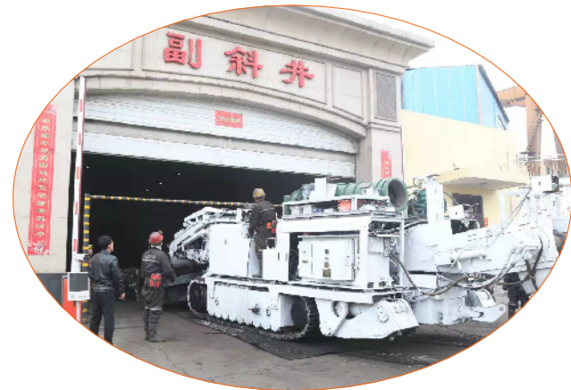
掘进机自动截割机器人

圆满收官“十三五”,奋力开启“十四五”。对标国内最高标准、最好水平,木瓜煤矿步履铿锵,全矿干部职工“苦干实干拼命干”,正续写改革驱动下的智能化矿井建设“时代篇章”。