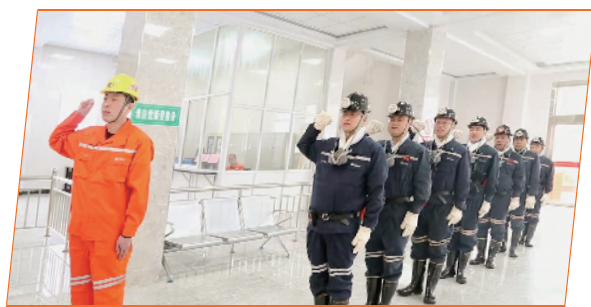
职工入井安全宣誓