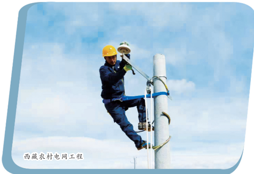
西藏农村电网工程

西藏和平解放初期,电力工业从零起步,农牧区用电无从谈起。70年来,中央始终把解决农牧区用电问题作为各项工作的重中之重,西藏农村电网建设步伐也从未停歇。期间,曾有过西藏自治区成立初期“小水电遍地开花”的奋斗历程,也有过上世纪九十年代以来“一至三期农网建设”的峥嵘岁月。