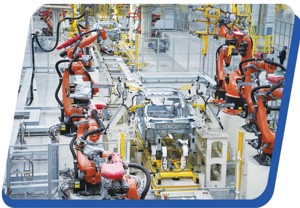
宝能汽车集团西安基地焊装车间自动化设备

“宝能汽车集团将积极抓住全球新能源汽车产业转型升级的契机，为我国民族汽车工业的发展贡献更大力量。”宝能汽车集团负责人表示。