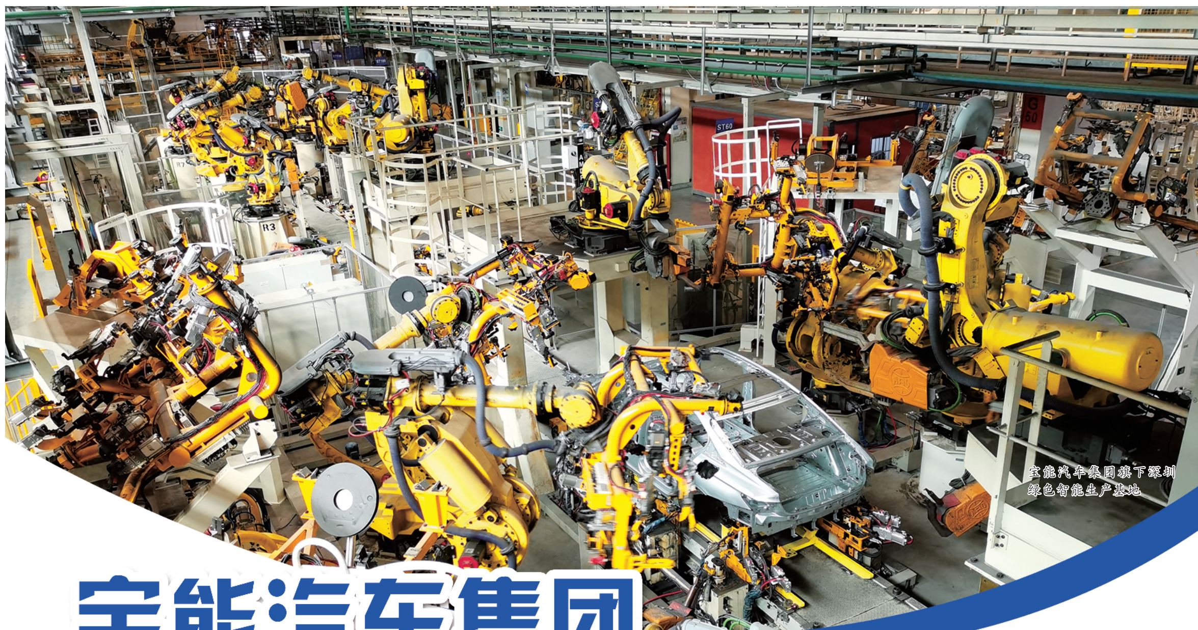
宝能汽车集团旗下深圳绿色智能生产基地