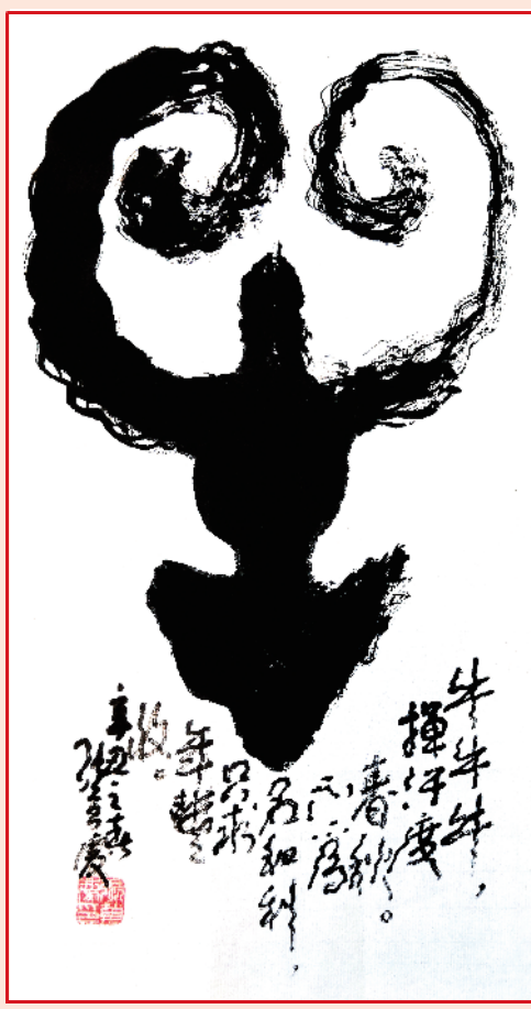
(作者为当代著名书法家) 张万庆