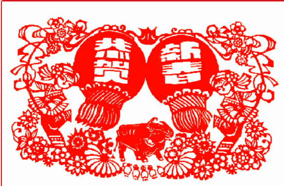
刘桂云 (作者为自由撰稿人)