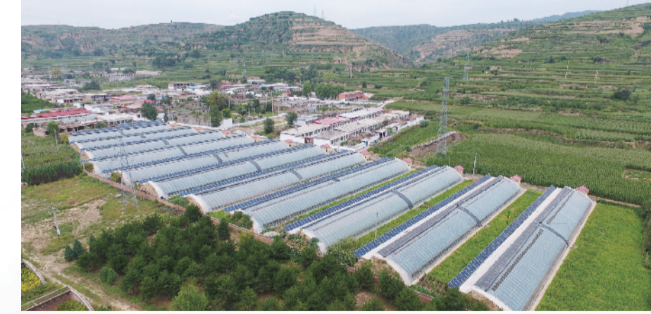
方山县桥沟村农光互补电站。

县级干部履职尽责。市级成立5个督查组对4个重点县、13个重点乡镇挂牌督战,161名县级领导干部下沉乡镇担任第一书记,推动责任落实。在去年向兴县、石楼2个深度贫困县派驻工作组的基础上,今年向临县派出由吕梁市人大常委会主任为组长的市决战决胜脱贫攻坚攻坚领导小组,领导指导督导临县脱贫攻坚。加大扶贫领域监督检查问责力度,10个贫困县实现专项巡察全覆盖。