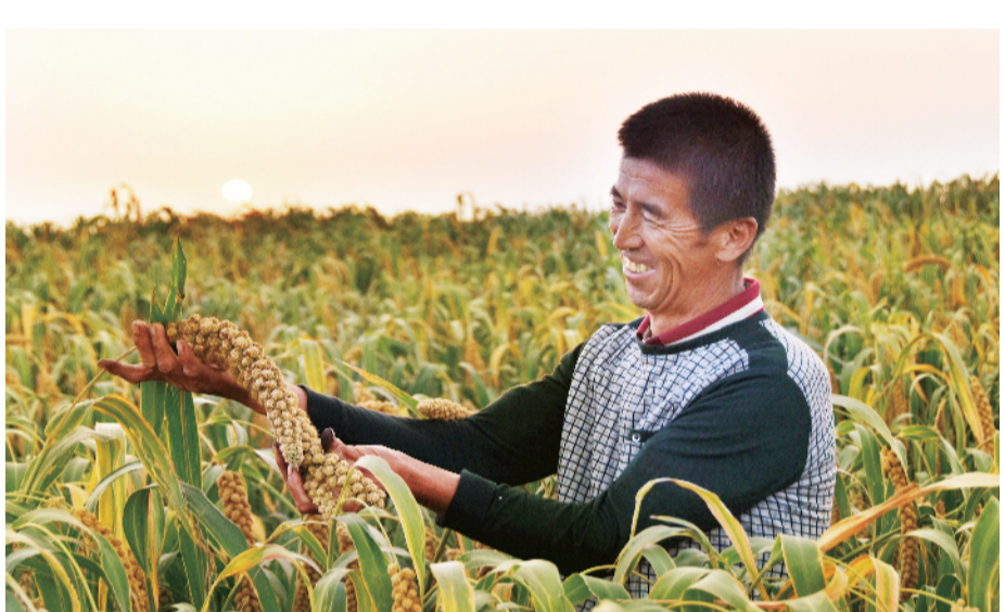
干旱之年喜丰收,渗水地矗立大功。

吕梁因吕梁山脉纵贯全境而得名,位于山西省中西部。1971年组建地区,2004年撤地设市,国土总面积2.1万平方公里,辖1区2市10县8个省级经济开发区1个省级生态文化旅游示范区,161个乡镇(街道),截至2019年底,总人口达385万。 吕梁历史悠久,是人类文明重要发祥地,远在旧石器时代就有人类繁衍生息。吕梁人文荟萃、英才辈出。有一代女皇武则天、初唐诗人宋之问、宋朝名将狄青、清代天下第一廉吏于成龙等历史人物。近代以来,涌现出红军早期领导人贺晋,被毛主席亲笔题词“生的伟大,死的光荣”的革命英雄刘胡兰、“试管婴儿之父”张民觉、“山药蛋”派代表作家马烽等杰出人才。