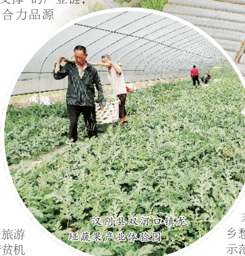
汉阴县双河口镇龙垭镇蔬菜产业体验园

阴县晒菊文化旅游月”的基础上,支持“周末哪儿去,汉阴有乡愁”农旅融合扶贫示范项目。以陕北矿业帮扶的汉阴龙垭村为示范,在集中安置社区旁规划200亩的农旅融合发展项目,布局乡村园区、采摘体验等项目,带动当地发展乡村旅游。