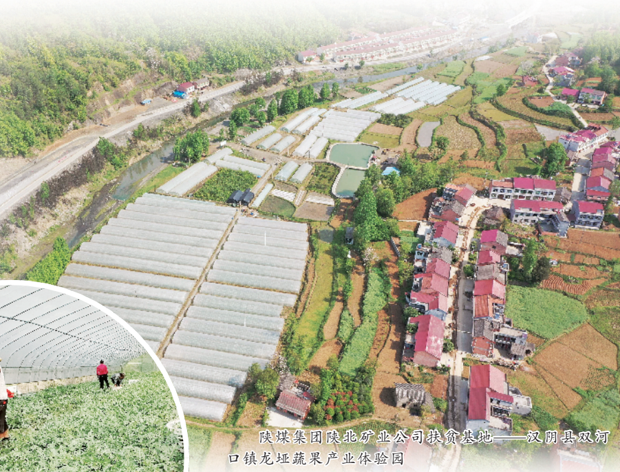
陕煤集团陕北矿业公司扶贫基地——汉阴县双河口镇龙垭蔬菜产业体验园

针对不同地区、不同致贫因素,陕煤集团挖掘当地特色资源,围绕“一村一策、因地制宜”,有序发展村集体经济。设立“陕煤榆林5亿元产业扶贫基金”和“陕煤汉阴5000万元产业扶贫基金”,已向榆林、汉阴县7家龙头企业投放4300万元;率先设立汉阴县开源证券首家“贫困县证券营业部”暨金融扶贫工作站,为汉阴县定制发放2亿元扶贫专项收益凭证,普及金融知识,提升金融意识,提高贫困人口收入。投入500万元助推汉阴“现代农业+生态旅游”产业发展,在成功举办“汉