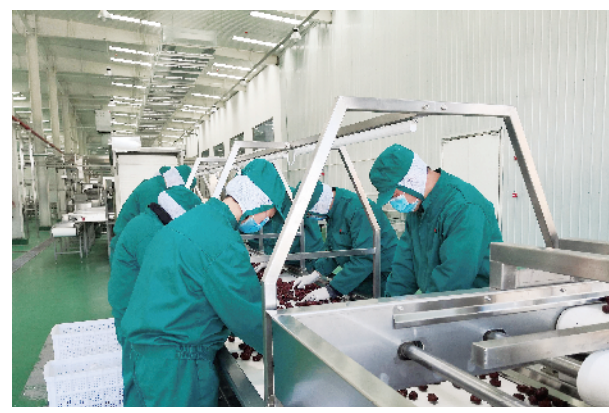
陕煤榆林合力产业扶贫开发公司北国枣业公司职工在红枣干制车间生产线工作