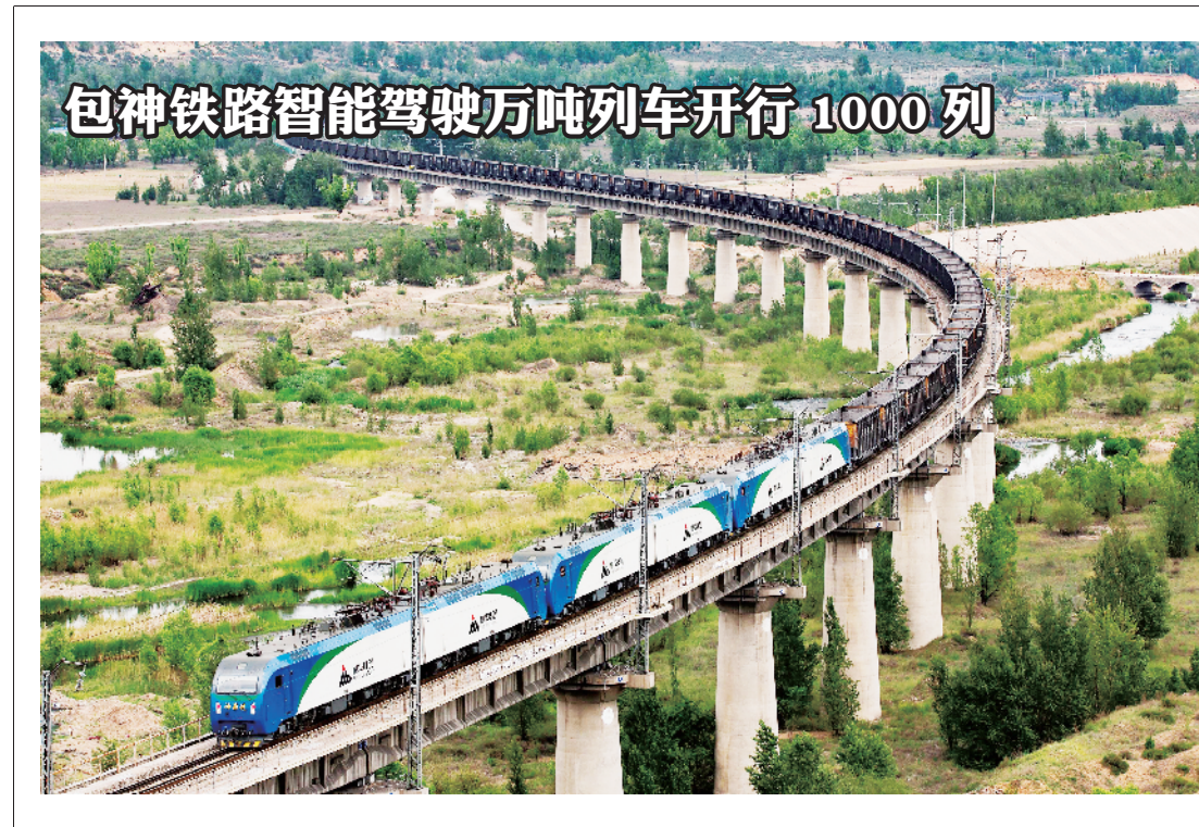
包神铁路智能驾驶万吨列车开行1000列

由于云南神火仍处于建设期,尚未并入业绩报表,神火股份的电解铝产量目前均来自新疆煤电。此次重组究竟能带来多少效益,本报将持续关注。