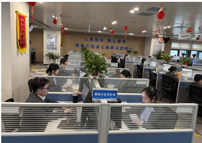
合肥市12345热线设置“春晚分会场专席”，服务今年央视春晚合肥分会场群众诉求。

“在解决跨区域、跨部门、跨层级的疑难诉求中，仅靠某一部‘单枪匹马’难以突破部门信息壁垒和内部制度规定。联动多方合力，构建联席共治共商机制，协同发力，方能破解治理难题。”合肥市12345(民声呼应)热线中心相关负责人表示，未来，合肥市将紧扣建设创新、宜居、美丽、韧性、文明、智慧的现代化人民城市目标，做到“大事不放松、小事不放过、难事不放弃”，埋头苦干、久久为功。[相关案例资料由合肥市12345(民声呼应)热线中心陈万亮、丁守刚提供]