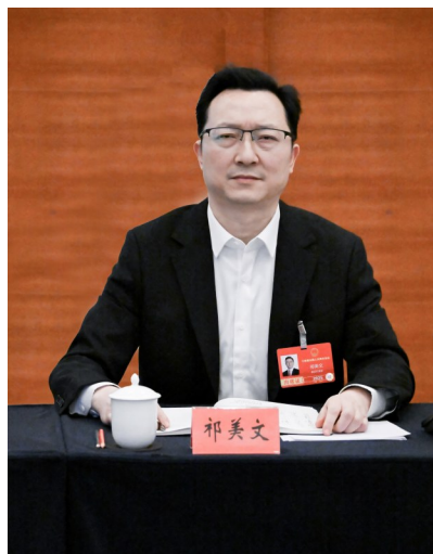
全国人大代表、重庆市沙坪坝区委书记祁美文。