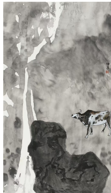
《山中欢牛》刘仲原作