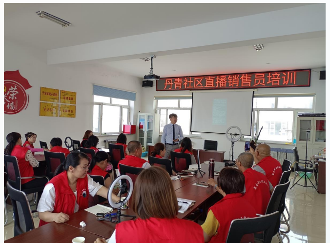
乾安县丹青社区开展技能培训活动。

导、社工运作、多方参与”服务模式,推动构建“室内学习+户外探索”的儿童友好空间体系。依托社区党群服务中心打造儿童服务站3个,优化设施资源,将服务站划分为“书香阅读区”“创意工坊区”“心灵驿站区”等功能区域,配备多媒体设备,以及适龄图书、益智教具、手工材料、儿童绘本等1000余册(套),进一步提升服务站的吸引力与实用性。同时,与图书馆、园林管理处、科技馆等单位合作,拓展户外实践基地3处,每日服务儿童约100人。