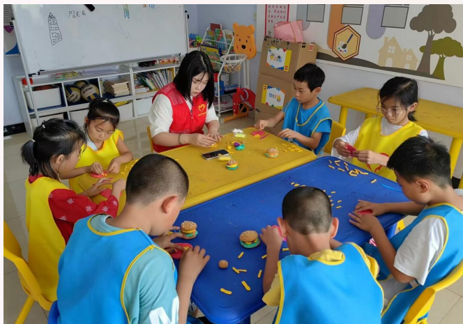
乾安县德建社区开设儿童兴趣课堂,丰富儿童课余生活。

党员志愿服务,守护童心港湾。广泛开展党员志愿者走访活动,深入推进困境儿童关爱保护工作,为健康成长“保驾护航”。组织559名社区网格员、“双报到”在职党员成立志愿服务队,上门走访困境儿童家庭,准确掌握困境(重点)儿童基本信息,建立关爱台账,发挥党员先锋模范作用,落实“一对一”结对帮扶,帮助解决实际困难,为困境儿童家庭送去党组织的关怀和温暖。去年以来,共开展走访慰问18次,圆梦“微心愿”64个,为6名孤儿和事实无人抚养儿童发放基本生活补贴4.6万元,为17名残疾儿童办理并发放重度护理补贴1.45万元,在册城乡低保儿童实现应保尽保。累计帮扶困难学生27人次,申请临时救助金1.7万元。