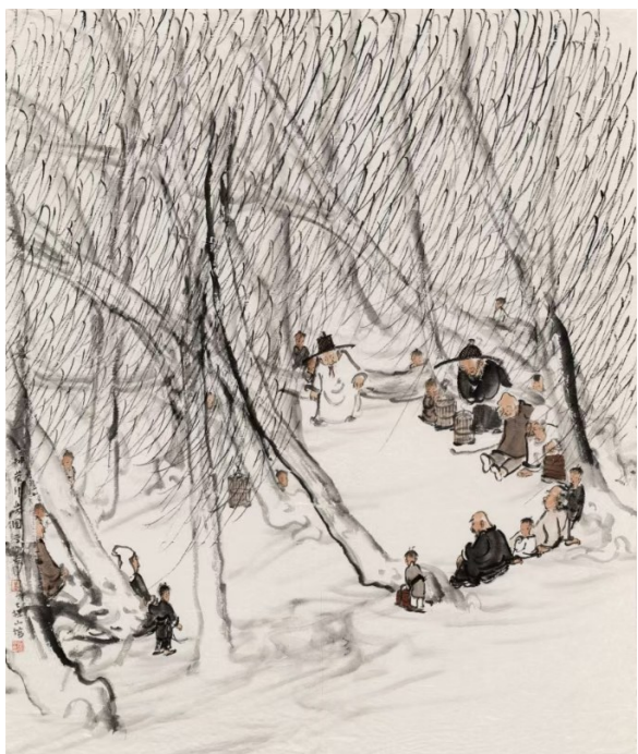
《柳荫行乐图》李学明作