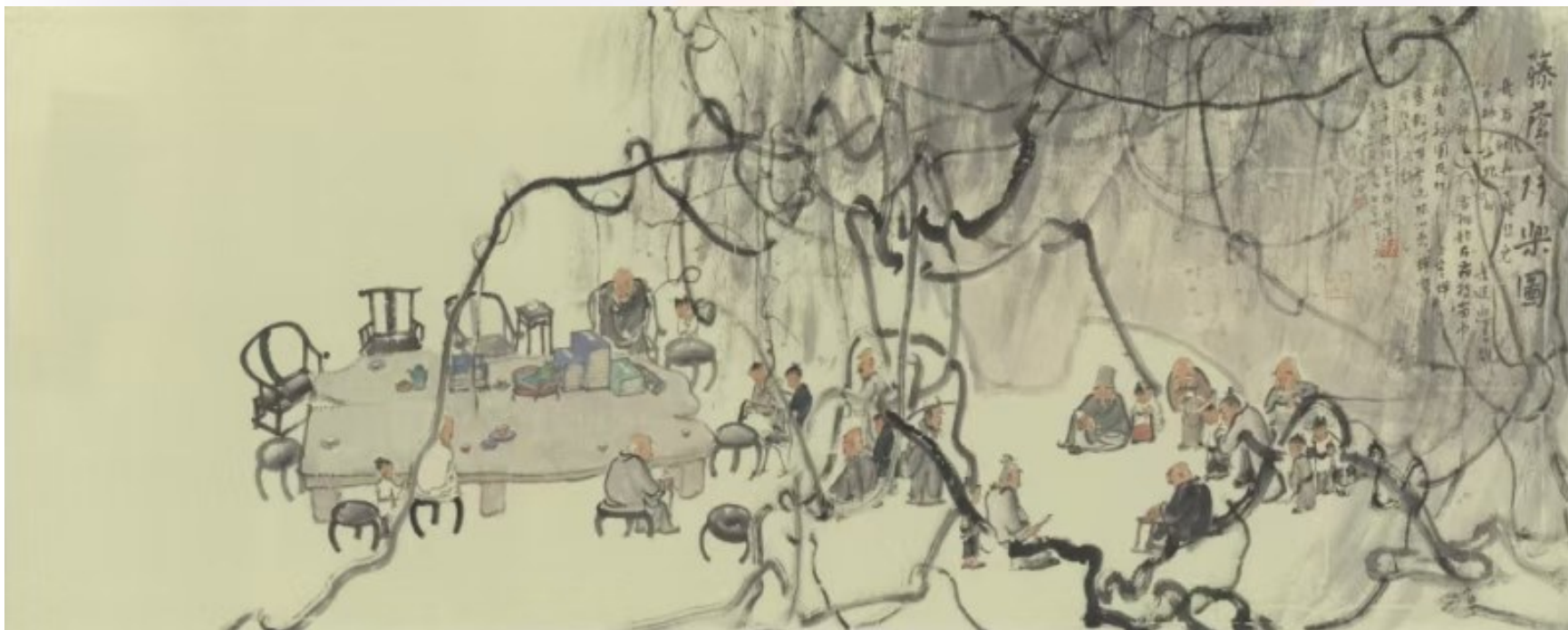
《藤荫行乐图》李学明作

“画者，文之极也。”李学明有澄明的文胆，有发展的眼光，有开拓的魄力，也有担当的能力——坚持笔墨的固本培元，坚持笔墨的守正创新，坚持中国气派，以笔墨立德、立功、立言。走进李学明的艺术世界，我们能够感受到那份质朴的文人懿德、真诚的浩然情愫。（作者系评论家、画家、中国人民大学教授）