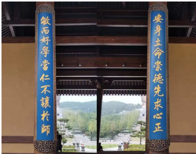
著名书法家张仲亭先生为尼山圣境大学堂题写的楹联。上联：安身立命崇德先求心正；下联：敏而好学当仁不让于师

据了解，张仲亭曾任中国书法家协会理事、山东省书法家协会副主席、济南市书法家协会主席。他自幼酷爱书法，学书60余年，以创意举办“一山一水一圣人”大型书法系列展而声名远播。他题写的“天下第一泉”被济南市申请注册成宣传图标；他书写的泰山碧霞祠对联，20多年来一直悬挂在碧霞祠碧霞元君两旁受万人瞩目；特别是2009年举办的第十一届全国运动会开幕式“大碗幕”上选用了他的书法《望岳》，成为其书法的典型代表。2016年，张仲亭两次在北京举办个人作品展，均以宣传国学经典为主；2017年7月20日，《人民日报》以“张仲亭，期待为经典插上翅膀”为题，报道了其书法创作活动，并对其创作方向与书法实绩给予充分肯定。