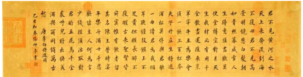
张仲亭书李白古诗《将进酒》