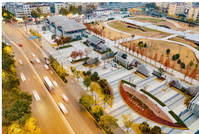
位于山东省济宁市任城区的河道总督署遗址公园景观鸟瞰。

“济宁是一座因河而兴、因水而盛的城市，而任城区作为整个运河的河道中枢，除了南船北马的粮食、货物运输之外，也承载了多元文化的融合，塑