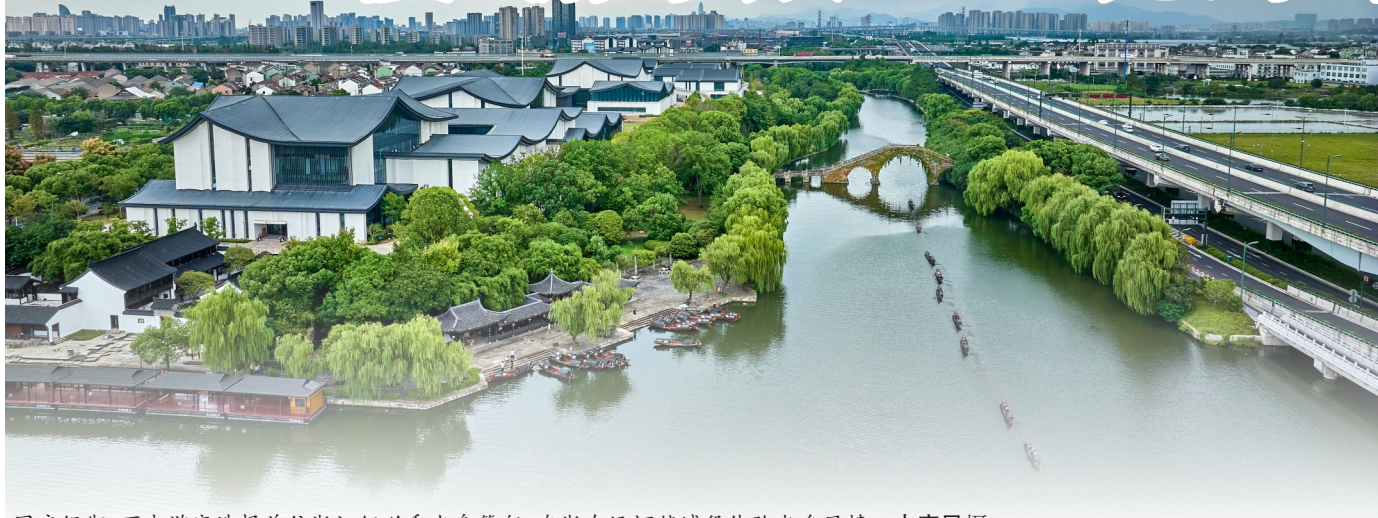
国庆假期,不少游客选择前往浙江绍兴乘坐乌篷船,在浙东运河越城段体验水乡风情。