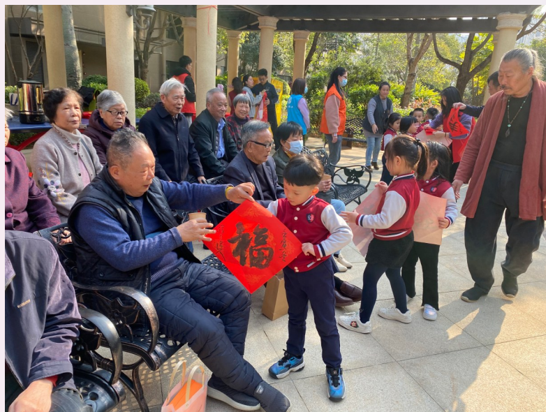
▲广东省汕头市龙湖区龙腾街道津海社区联合美恩幼儿园组织开展“学雷锋送关怀小棉袄进泊湾”活动。

区能人、“两代表一委员”等群体中选任网格长和网格员，配备12名兼职网格员，促使力量更聚集、管理更精细。推动社区党组织下属党支部（党小组）设置与基层治理网格相统一，目前已建立党支部的网格数4个，健全“社区党组织—党支部（党小组）—党员中心户—一联系户”网格管理模式，由街道挂钩领导、相关部门同志和社区“两委”干部、楼长包干到人到户，打造“邻里共治”党建，协助开展矛盾纠纷调处、便民服务、法治宣传等工作，推动社情民意在网格中掌握、矛盾纠纷在网格中化解、民生服务在网格中办理。