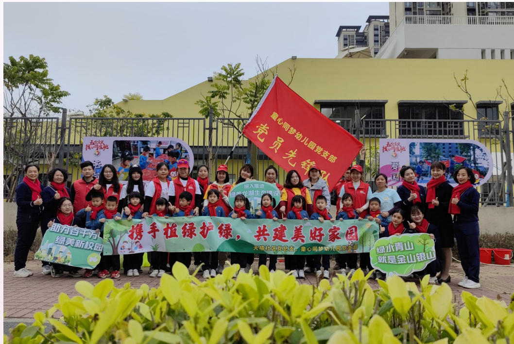
▲广东省汕头市龙湖区龙腾街道天禧社区党总支联合童心同梦党支部开展“携手植绿护绿 共建美好家园”义务植树活动。

深化网格管理，优化基层社会“微治理”。龙腾街道综合辖区楼栋、人口分布、地理位置等情况，合理规划12个基础网格，做到覆盖范围横向到边、纵向到底、界定清晰，实现网格全域有效覆盖。同时，配强工作力量，从“两委”干部、支部委员、党员、片区民警、社