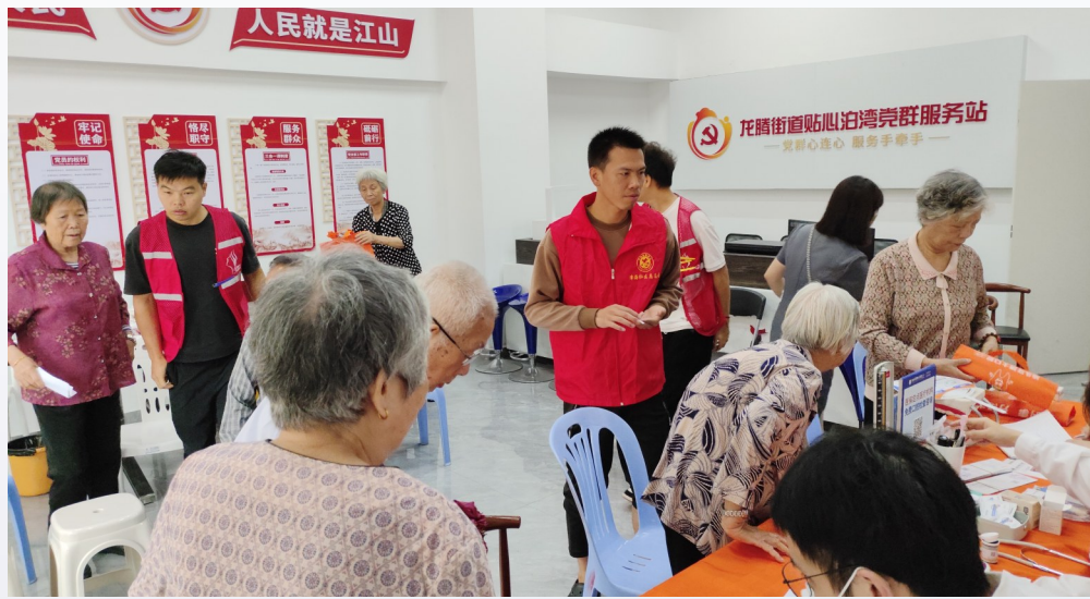
广东省汕头市龙湖区龙腾街道津海社区在贴心泊湾党群服务站开展“爱心义诊 暖心服务”活动。

打造一体化红色教育基地。聚焦资源整合、功能完善、作用发挥，高质量打造一批集教育、学习、体验、展示为一体的党员教育阵地，依托能量湾党史学习教育基地创建“能量湾”党建品牌，将党建教育基地从室内延伸至户外，以户外“开放式党史馆”的形式，把党建、自然、人文、历史融为一体，打造一个开放式、共享式、全天候的“家门口”红色教育基地，营造“处处是课堂、时时受教育”的正能量氛围。整合保利和府小区公共教育资源，串联起由联心站、议事亭、薪火阁、和美厅以及侨韵大道构成四点一线“和侨园”党建品牌服务阵地，并设置“侨文化”展厅、红色直播间、志愿服务站等功能区域，让业主在体验侨文化的同时，接受红色文化熏陶。比如，在保利和府小区举办“英歌潮起、乐动龙腾”专场主题演出，将非遗民俗潮汕英歌舞与传统乐器创新融合带入社区，让广大居民在“家门口”就可以感受到潮汕传统文化的魅力。