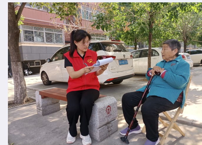
山东省济宁市兖州区红色楼栋长在社区内现场征询了解居民对改进社区治理和民生服务工作的诉求和意见建议。

人、未成年人和精神障碍患者等重点人群基础数据,提高基于高频大数据精准动态监测预测预警水平。酒仙桥街道聚焦老年人等特殊群体,在社区党群服务中心设置“叫车”终端,让不会使用智能手机的老年人,通过点击屏幕“一键叫车”即可享受用车服务,实现了智慧服务向“银发群体”的覆盖。搭建智慧社区服务场景。创新政务服务、公共服务提供方式,推动就业、医疗、救助等服务“指尖办”“网上办”“就近办”;加快城市社区嵌入式服务设施建设,实施智慧便民设施进社区工程,依托党群服务中心便民信息服务网络,建设24小时自助服务站,投放政务服务一体机等自助服务设施,让基层治理触角更灵敏、服务群众网络更稳固;聚合社区周边生活性服务资源,链接社区周边商户,推动无人售货设备、自动售水机、智能医生、智能回收衣柜等智能设备进社区,建设便民惠民智慧生活服务圈,打造多端互联、多方互动、智慧共享的数字社区生活,目前已累计覆盖70余个小区,服务居民群众73230余人次。搭建智