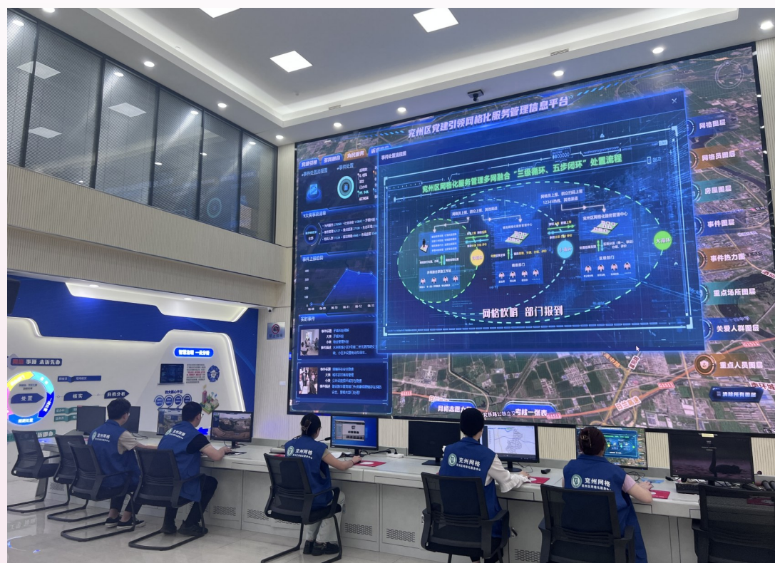
山东省济宁市兖州区开发党建引领网格化管理信息平台,构建“一核多元 一网统筹”的服务格局,推进“睦邻党建 幸福家园”建设。