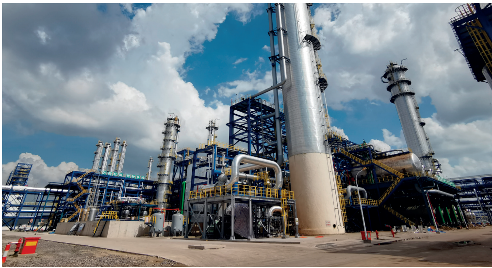
龙达恒信工程咨询有限公司参与鲁清石化年产120万吨轻烃综合利用工程咨询项目。图为该工程外景。