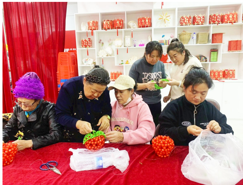
蛟河市民主街道河南社区组织居民开展手工艺品编织活动。

社工岗250人，落实薪资待遇，制定岗位职责，建立全员培训、轮岗轮训、考核奖惩制度，加强日常管理；定期召开经验交流会和业务培训会，分批次组织基层治理专干到市委组织部和街道跟班学习；全面推行“全科社工”，设立“全岗通”服务窗口19个，明确“三不让”和“三个必须”要求，实行首问负责、轮岗接待、下沉走访工作制度，开展政务办理、领办代办等服务3000余次。