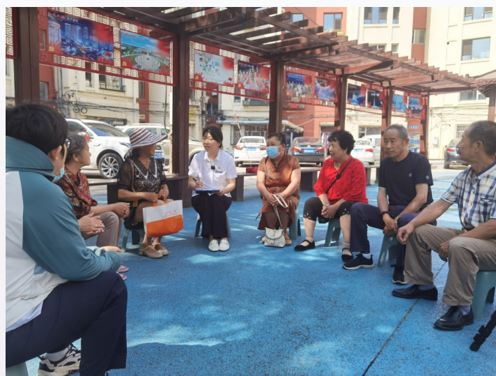
昌邑区新地号街道维北社区召开“小板凳”议事会。

阵地是党群开展活动的必要场所，更是近距离服务群众的渠道。近年来，吉林省吉林市昌邑区着力构建“家门口”小阵地，在突出党建引领、强化社区治理、服务群众上做文章、下功夫，不断找出新的工作思路和服务点，真正让网格员服务群众成为聚焦民心、有情怀有温度的重要阵地。