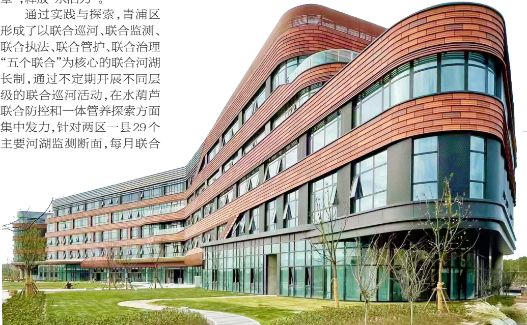
位于上海市青浦区的复旦大学附属妇产科医院长三角一体化示范区青浦分院建筑外景。

中国城市报记者了解到,西岑科创园区在示范区打造“世界级滨水人居文明典范”的总体愿景下,正承接启动“生态绿色高质量发展、跨界融合创新引领、世界级水乡村居典范”的目标要求,在双碳智慧实践、科创产业集聚、新江南小镇示范三方面体现标杆性,将为长三角科技创新共同体建设提供先行示范,为青浦区和长三角地区的经济社会发展注入新的活力和动力。