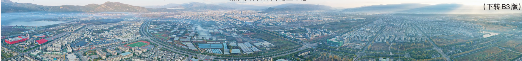
丽江市城区景观鸟瞰。