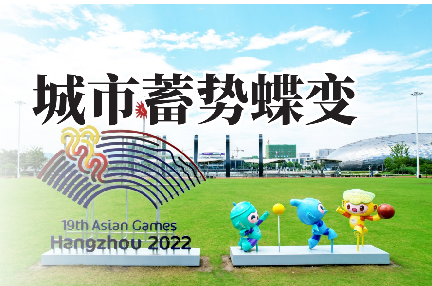
湖州市内亚运氛围街景引人入胜。