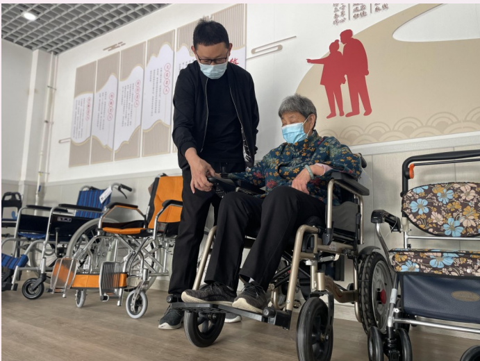
秦皇岛市北戴河区社区居民在社区体验康复辅助器具租赁服务。

河北省秦皇岛市北戴河区坚持党建引领,抓组织、强基础,抓能力、强队伍,抓示范、强融合,积极推动基层治理格局不断优化。