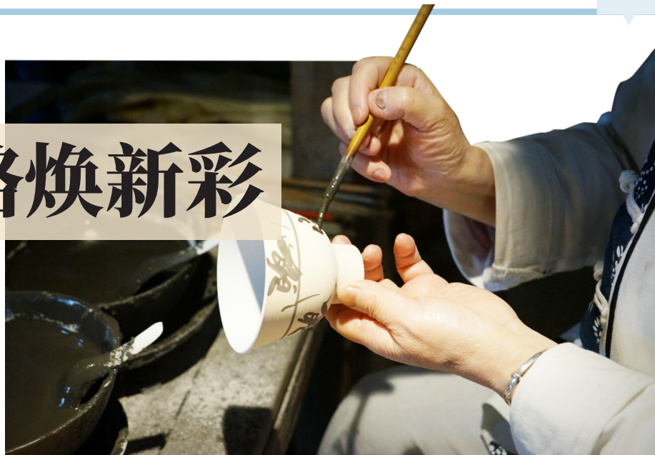
景德镇古窑非遗传承人展示传统手工制瓷技艺。