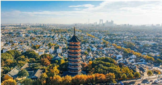
江苏省苏州市“姑苏古城”风光鸟瞰。

坚持微更新“主构图”,以“文火慢炖”的态度留住原居民、延续烟火气,让街区气质颜值与百姓幸福指数同步提升;运行强文化“主笔法”,持续打造文化特色鲜明、功能设施齐备、场所活力充沛的复合型文化街区……如今的仁丰里已经成为了扬州居民享受业余文化生活的最好去处之一。