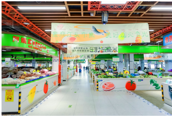
改造后的夏商江头市集面貌焕然一新。

疫情防控中“豁得出”。疫情期间，夏商集团承担市场保供稳价、市民口罩发放和隔离安置三大任务，设置党员责任区、先锋岗32个，志愿服务队伍32个，500多名党员带动5000多名职工冲锋市场保供一线。在2021年同安区疫情暴发期间，集团6天完成中埔一级批发市场建设，与闽夏市场形成“双一批”运转模式确保厦门蔬菜供应。党委班子带领各部门各企业轮班支援同安“菜篮子”供应，每日完成1万多份蔬菜分拣配送任务，累计分拣124万份（311万公